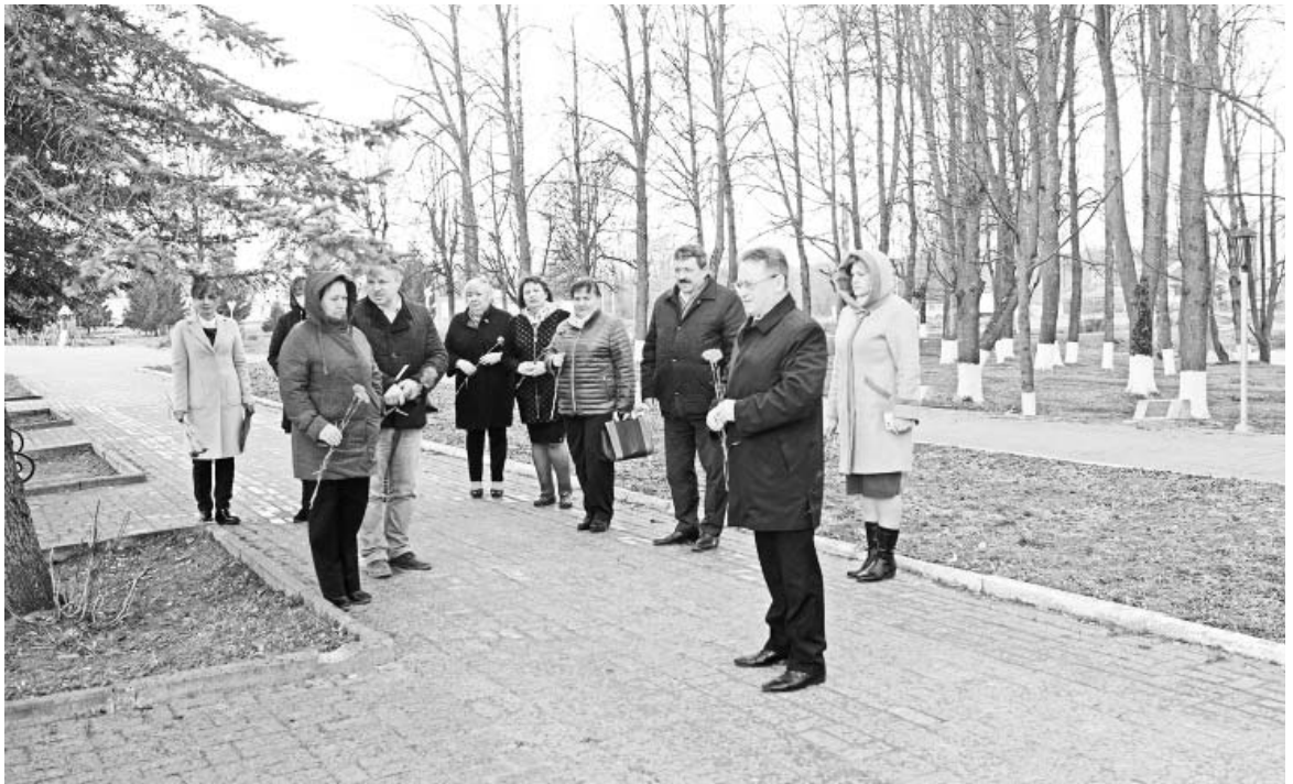
В Думиничах 10 апреля почтили память узников фашистских концлагерей. Представители администрации района возложили цветы к памятнику в Нижнем сквере.